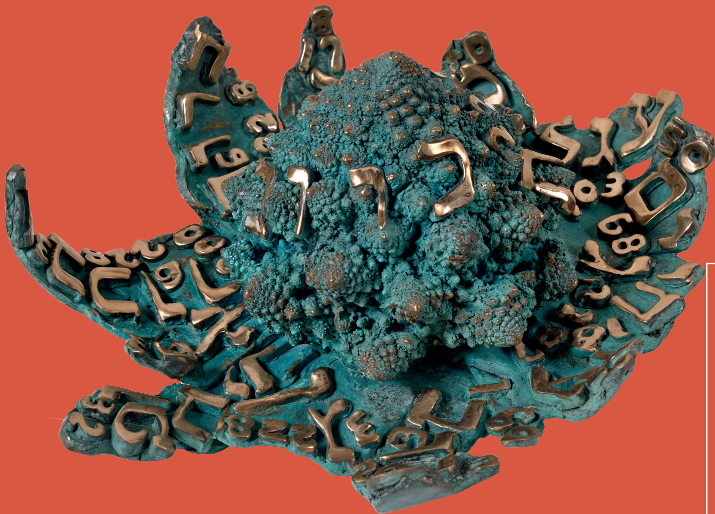
Tobia Ravà. 1359 "Cherubino romano".